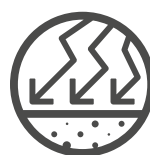
Hohe Haltbarkeit und Belastbarkeit