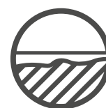
Unebene Oberflächen ausgleichen