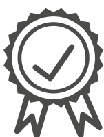
Hohe Qualität und geprüfte Produkte