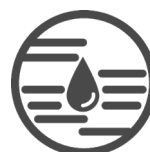
Nässeunempfindlich und abwaschbar