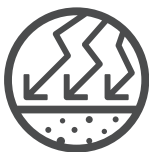
Hohe Haltbarkeit und Belastbarkeit