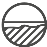
Unebene Oberflächen ausgleichen