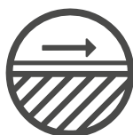
Fugenlose Boden- und Wandbeschichtung